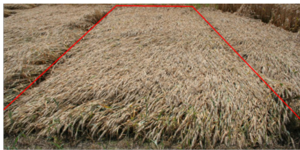
Lagerindex = 90