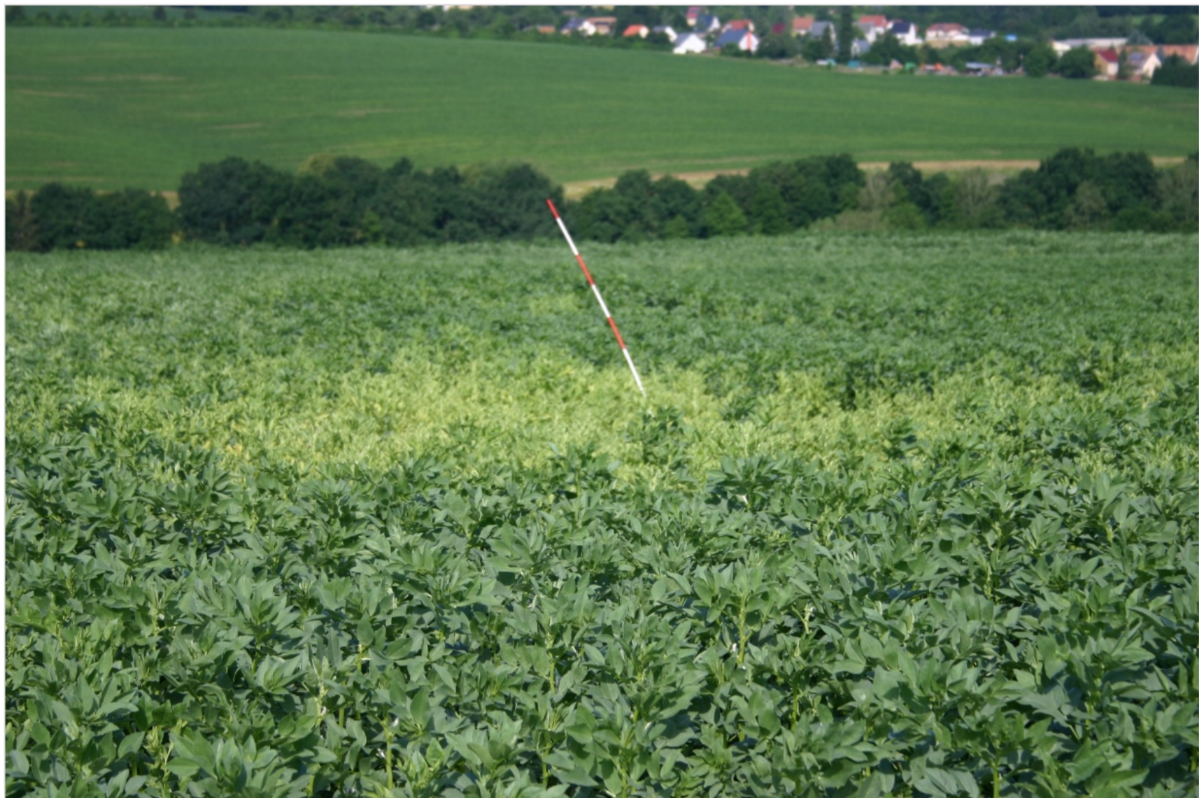
1. Juli 2016