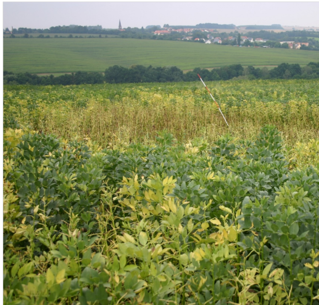
26. Juli 2016