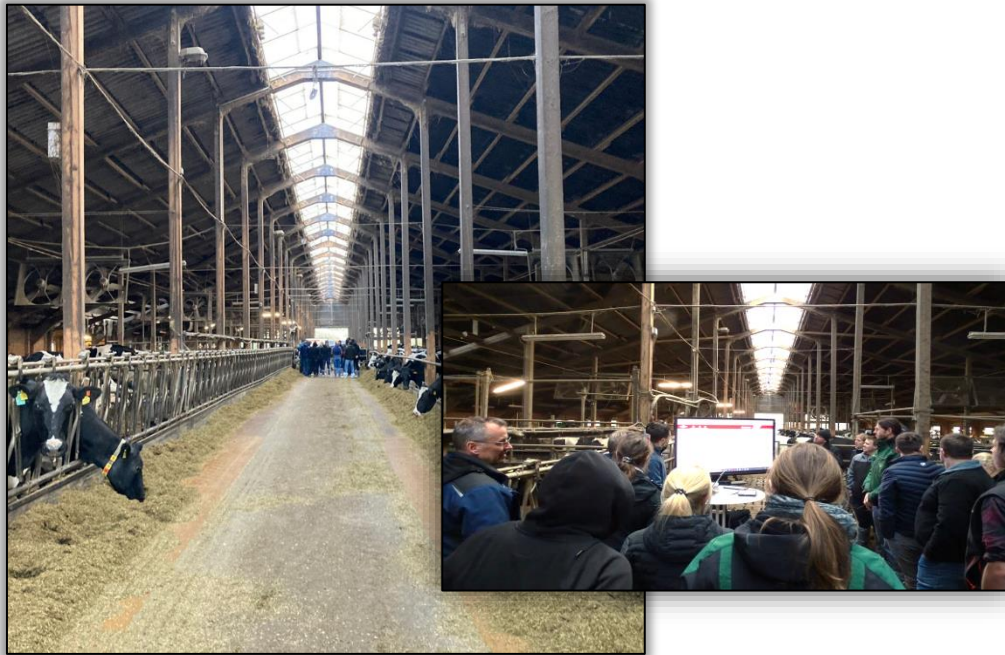
Abbildung 1: Die Teilnehmenden des Anwenderseminars verschaffen sich einen praxisnahen Einblick in den Umgang mit Assistenzsystemen

Am 14. November 2023 fand im Rahmen des Experimentierfeldes Landnetz erstmals das Anwenderseminar für Assistenzsysteme in der Rinderhaltung statt. Unterstützt wurde das LfULG bei der Ausrichtung durch die agro prax Gesellschaft für Tiermedizin und Betriebsbegleitung mbH. Das Seminar wurde auf dem Landgut Nemt im Landkreis Leipzig durchgeführt und war mit 30 Teilnehmenden gut besucht. Zu den Gästen zählten Landwirt/-innen und Herdenmanager/-innen sowie Vertreter/-innen des vorgelagerten Bereichs.