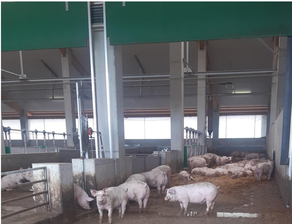
Außenklima-Tierwohlstall auf Tiefstreu

Mittlerweile liegen umfangreiche Erfahrungen aus der Baupraxis und erste Erfahrungen aus der Haltung der Tiere vor. Zunächst konnte festgestellt werden: „Die Schweine wachsen, sie sind gesund und glücklich, so dass sie auch überwiegend mit intakten Ringelschwänzen ausgestattet werden können“.