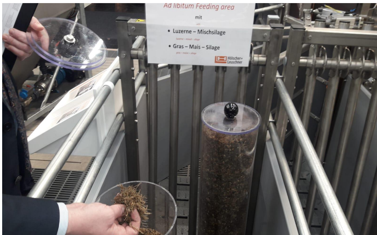
Foto „SAUWOHL-OPTIMIERTE-FÜTTERUNG“ (SWOF) vorgestellt auf der EUROTIER.