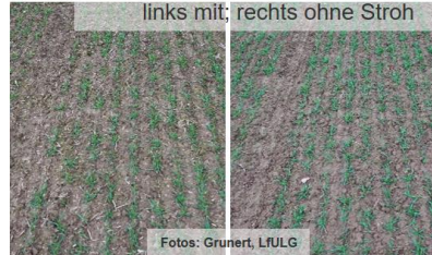
Versuchspartellen am 9.12.2020 links mit; rechts ohne Stroh