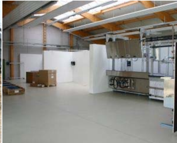
Lehrwerkstatt Technik der Innewirtschaft ( Aufbau der Melktrainer )