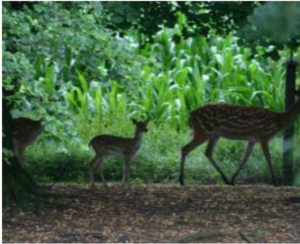
Damwildmuttertier mit ihrem Kalb