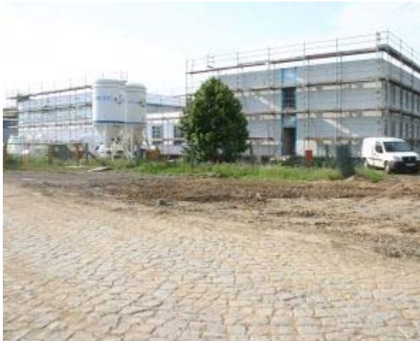
Bau des Lehrlingswohnheimes im Juli