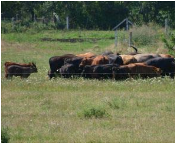
Angusfleischrinder stellen sich im Kreis um sich vor der Hitze zu schützen