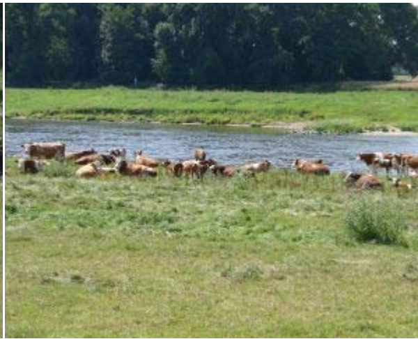
Fleckviehfleischrinderherde an der Elbe