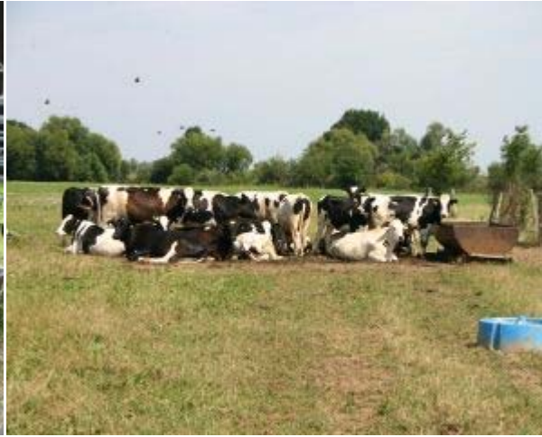
Trockenstehende Schwarzbunte Färsen bei großer Hitze am Tränktrog