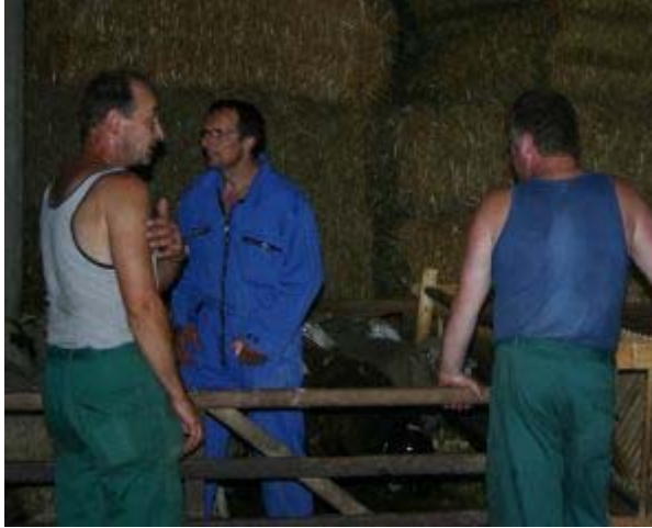
Bewertung der Schlachtlämmer durch den Abholer ( 2 v. li. ) Aufmerksam verfolgen die Mitarbeiter des Bereiches Schafzucht die Preisbildung