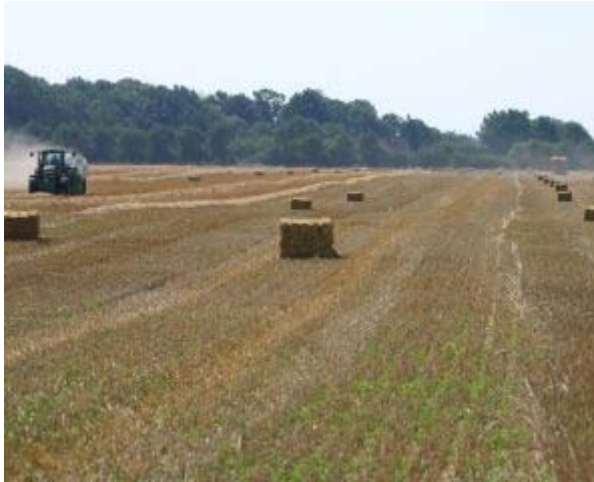
Pressen mit einer Quaderballenpresse und Abtransport des Weizenstrohs mit Ballenladewagen, das Stroh benötigt die Tierhaltung