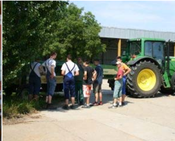
Die Gruppe beim Anhängen eines Mähwerkes, Aufbau und Funktionsweise des Mähwerkes werden erklärt