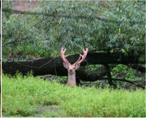
Aufmerksamer Sikahirsch mit Bastgeweih im Köllitscher Altelbarm