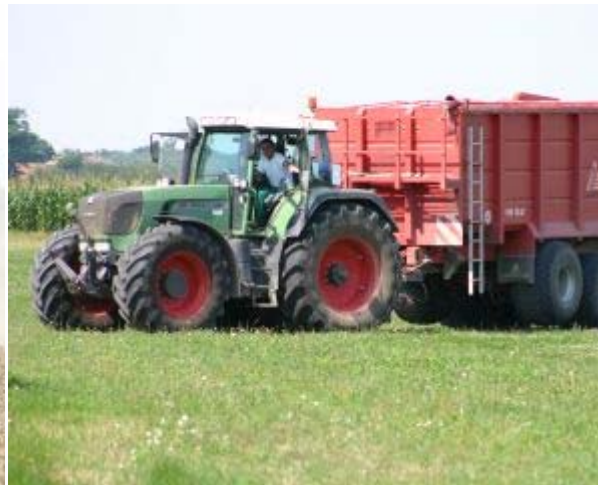
Herr Olaf Eimecke bereitet sich auf den Abtransport des Getreides vor