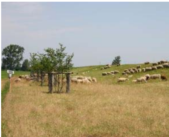
Gruppe von Schafen auf dem Elbdamm