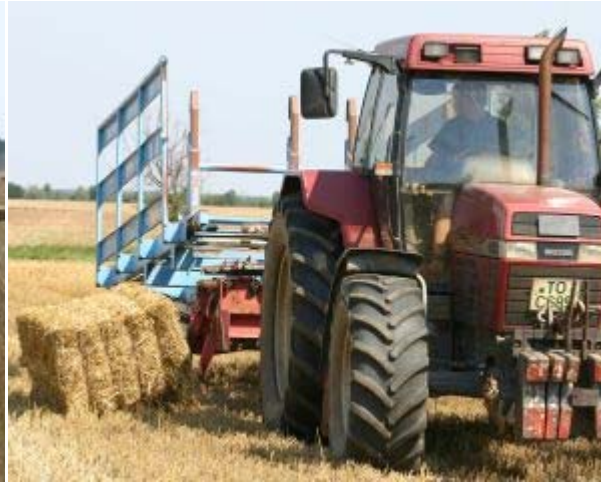
Fastfahrarbeiter Jörg Schmedchen bei der Aufnahme eines Ballens