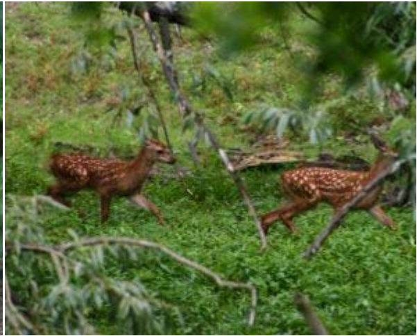
2 Sikakälber freuen sich des Lebens