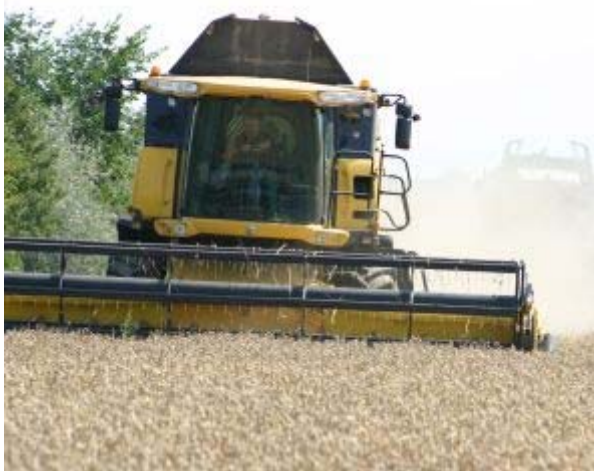
Zwei Mähdrescher auf einem Weizenschlag