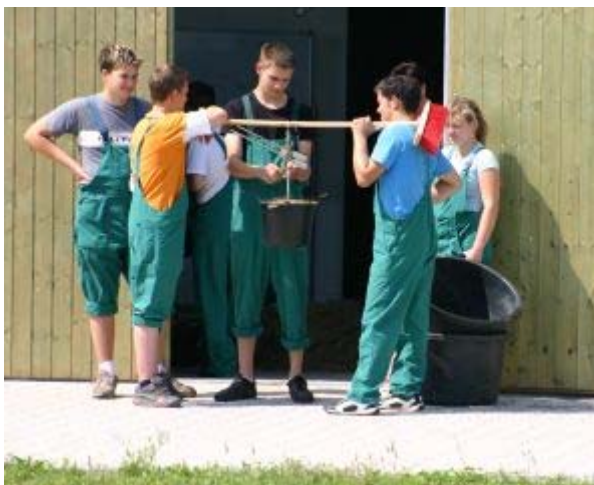
Teilnehmer des Lehrganges Grundlagen Rind - Fütterung beim Wiegen von Futtermitteln