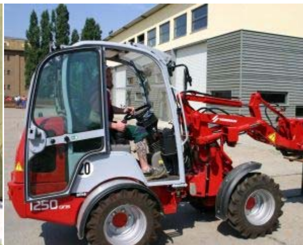
Üben mit dem Hoflader auf dem Technikhof beim Lehrgang Technik der Innenwirtschaft, die Teilnehmer kommen vom BSZ Altroßthal