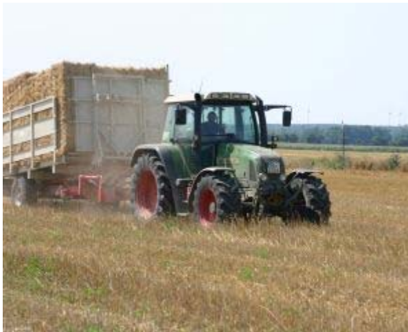
Zügiges Abfahren des Stroh durch Herrn Thomas Dieter