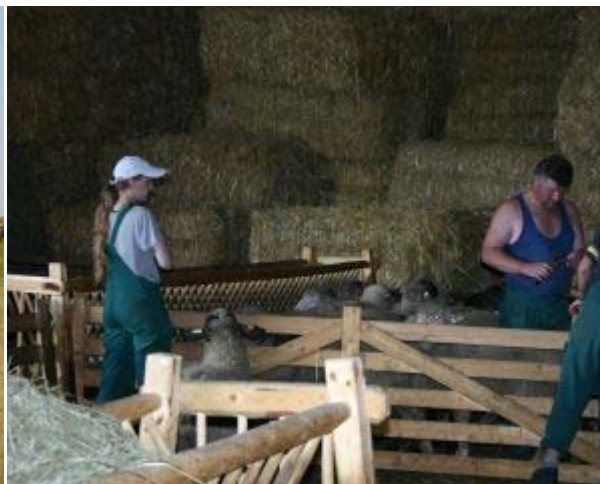
Kennzeichnung von Schafen mit Marken nach VVO die zur Schlachtung gehen