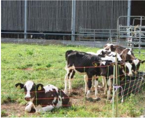
Gruppenhaltung von Kälbern im Freien