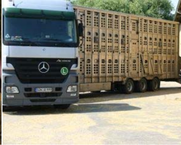
Vorbereiten des Aufladens der Schlachtlämmer auf den LKW